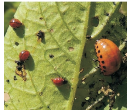
1-расм. Колорадо қўнғизи - Leptinotarsa decemlineata 1 - картошка барги билан озиқланаётган личинкалар.

Морфологик белгилари ва биологияси: тухумининг узунлиги 1,1-1,8 мм, эни 0,8 мм бўлиб, чўзиқ овал, ялтироқ, тўқ сариқ тусда. Личинкасининг узунлиги 15-16 мм бўлиб, тўқ сариқ-қизил рангда. Гумбаги 9-12 мм, ранги тўқ сариқ. Вояга етган зараркунанда узунлиги 7-12 мм, эни 4,5-8 мм бўлиб, танаси бўртган ва овал шаклига эга. Колорадо қўнғизи кенг майдонда 20-70 см чуқурликда қишлайди (Кимсанбаев Х.Х, Сулейманов Б.А, Мавлянова Р.Ф. 2013). Бу зараркунанда ҳашаротнинг урғочиси фақат итузумдошлар оиласига (картошка, помидор, бақлажон, қалампир) мансуб ўсимликлар баргининг остки юзасига тўп-тўп қилиб 12-80 тадан тухум қўяди (Кимсанбаев Х.Х, Сулейманов Б.А, Мавлянова Р.Ф. 2013). Ўртача бир урғочи қўнғиз 400-700 та, бир мавсумда эса 2400 тагача тухум қўйиши мумкин (Ш.Хўжаев, 2013). Тухуми 5-17 кун ривожлангандан сўнг личинка чиқади ва ўсимликнинг яшил қисми билан озиқланади. Личинкалари 16-34 кун